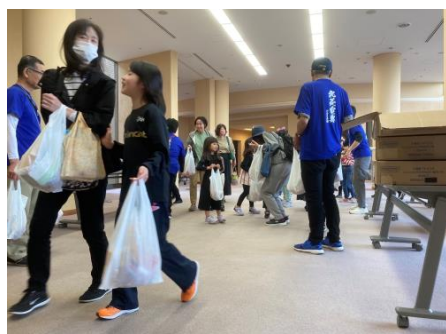
企業の協賛各社よりプレゼントをご用意