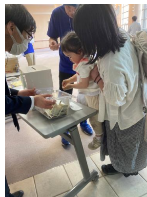
白山市・野々市市への募金コーナーを開設