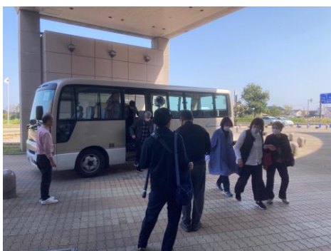
送迎シャトルバスも運行