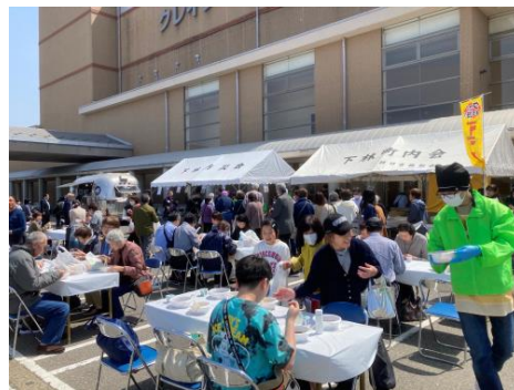
協賛社によるランチサービスは大好評